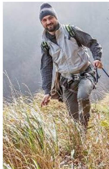
IN TOUR Alla scoperta delle colline delle Cerbaie

Il tutto a partire da questa domenica quando, con ritrovo alle 8.45 in piazza della chiesa a Galleno, prenderà il via il viaggio alla scoperta delle valli di Campanellini, fra Galleno e Orentano, nel Pisano, con pranzo alla Corte Tommasi a Orentano. Si tratta di un percorso lungo 13 chilometri con livello di difficoltà escursionistico. Per informazioni su costi e programma e per effettuare le prenotazioni obbligatorie entro venerdì, basta chiamare il 340.9847686.