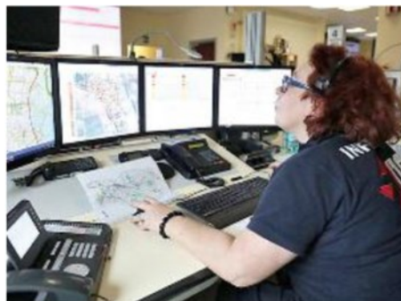
La centrale del 118 che dirige le chiamate di emergenza in una foto d'archivio