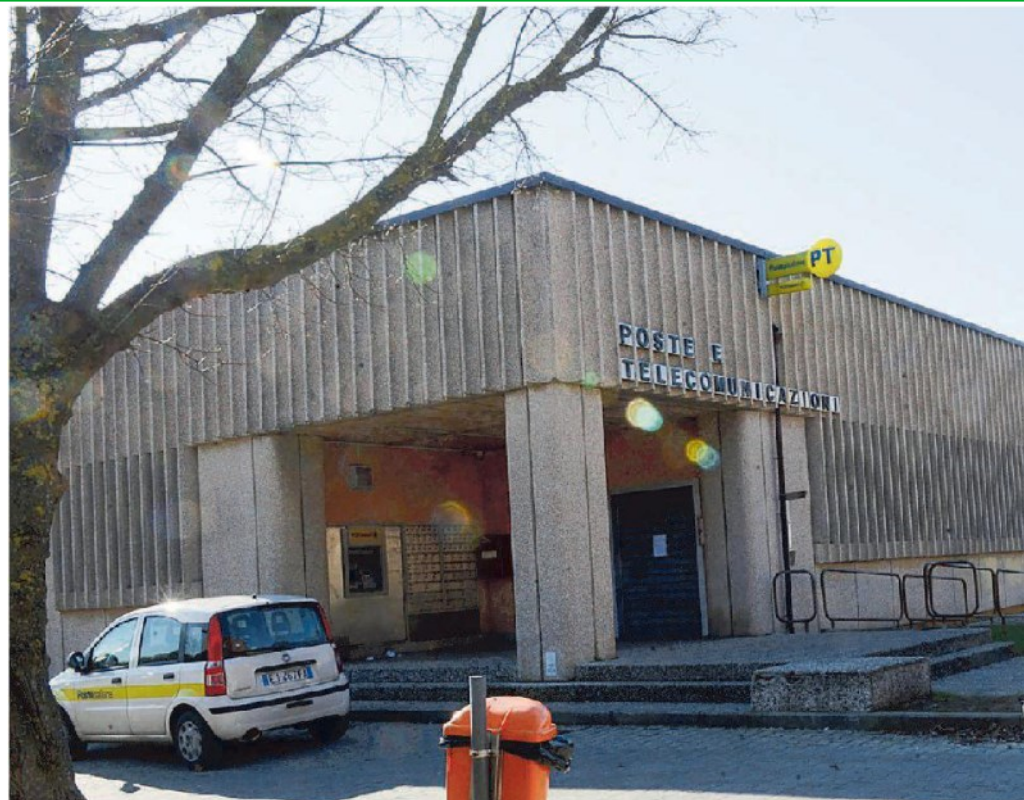
Uno degli uffici postali sul territorio di Cascina