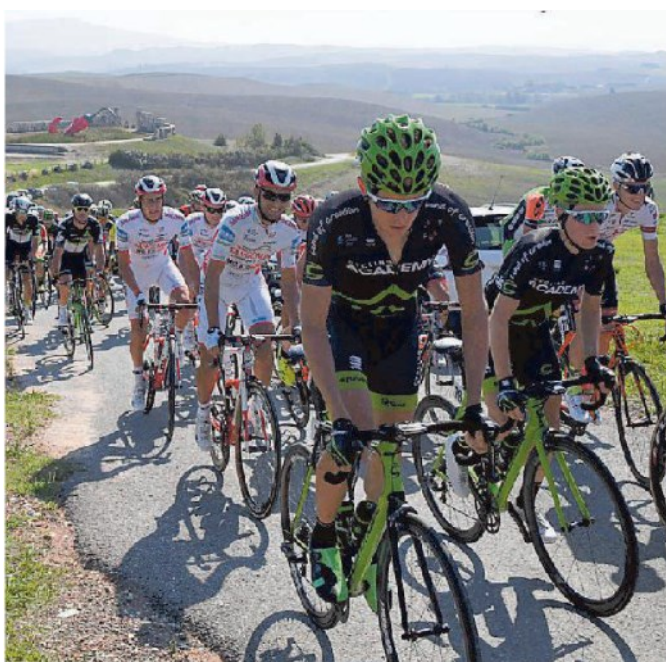
All'assalto di una delle salite sulle colline della Valdera