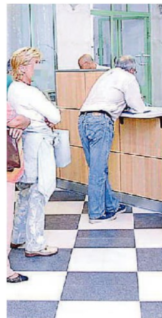
Un ufficio dell'anagrafe