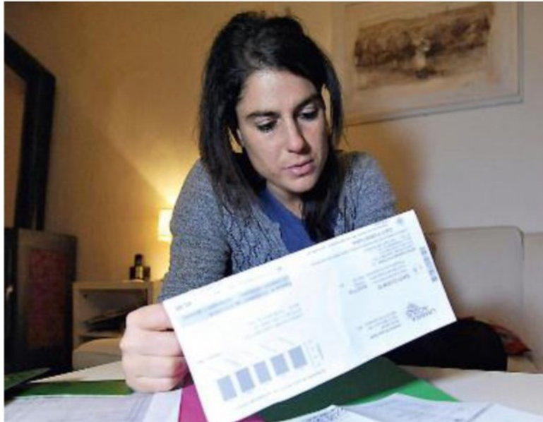
BOLLETTINI Successo della politica di riscossione dell'Unione Valdera