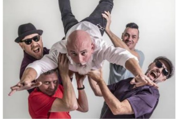
I Punkreas sono uno dei gruppi punk italiani più conosciuti