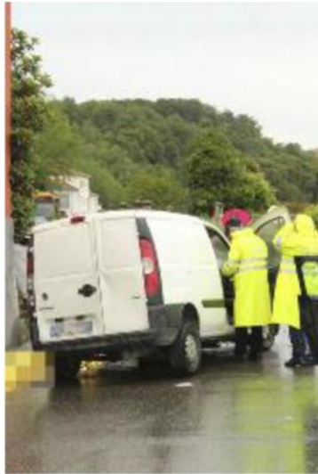
Una foto del terribile impatto