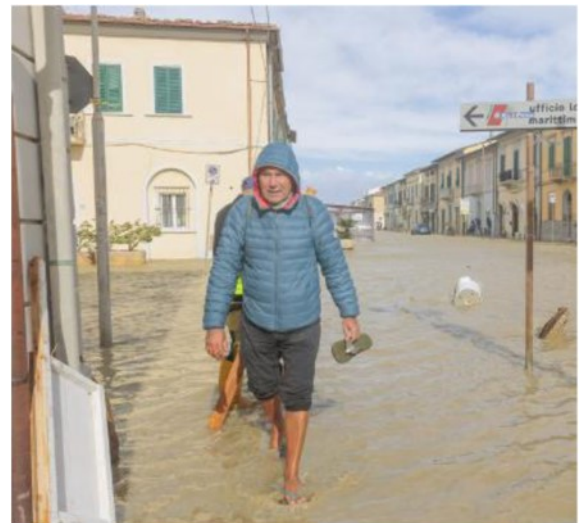
Marina di Pisa colpita dal maltempo

Dal litorale di Marina di Pisa alle colline della Valdera fino al Comprensorio del Cuoio