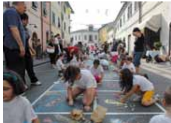
I bambini dipingono il corso del paese