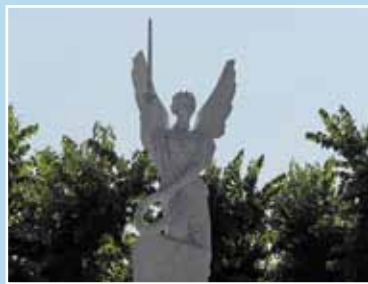
Il monumento ai Caduti in Piazza Indipendenza, prima e dopo l'intervento di ripulitura