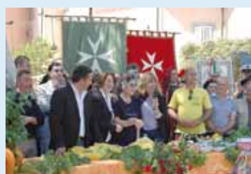
Un particolare divertente della diretta

Un'occasione ghiotta per tutti i cittadini e per tutti coloro che non hanno potuto assistere (direttamente o indirettamente) alla trasmissione per rivedere e rivivere i momenti di quella intensa giornata.