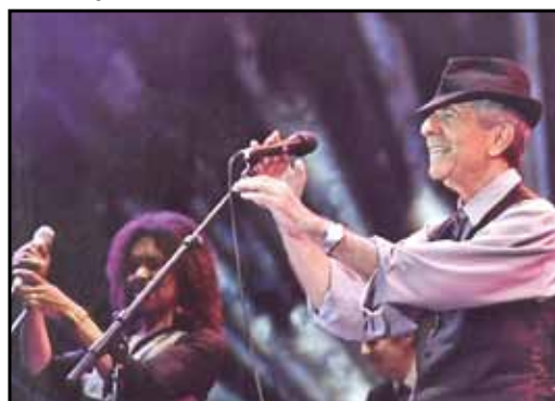
Nella foto Leonard Cohen in concerto