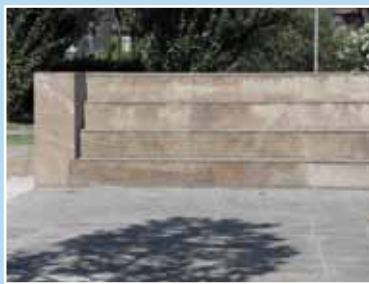
L'anfiteatro in Piazza Villanova del Cami, prima e dopo l'intervento di ripulitura