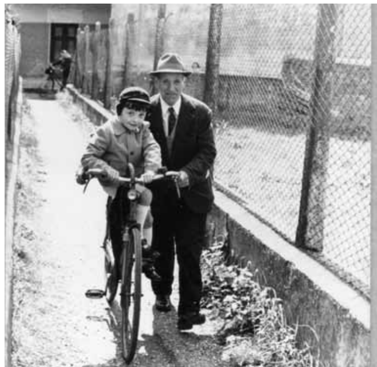
Chi sono le persone raffigurate? Il Nonno e il ragazzo che percorrono il "viottolo" che un tempo davanti alla Misericordia, portava dall'Asilo alla Chiesa? (oggi non esiste più infatti è parte della nuova piazza).