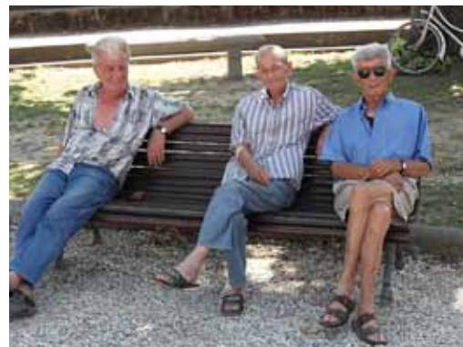
Tre calcinaioi seduti sulle nuove panchine nei giardini di Piazza Indipendenza

L'opera di restyling della Piazza non si è però fermata qua. Nuove panchine, sia in pietra che in legno, nuovi e più funzionali cestoni e posacenere e più cura del verde con fiori ed aiuole a donare un più garbato aspetto al cuore del capoluogo. Nuovi cestoni sono stati posizionati anche in Piazza Carlo Alberto e Piazza Manin (anch'essa abbellita con fiori e piante), due nuove bacheche che saranno costantemente aggiornate con notizie ed eventi organizzati dall'Ente comunale sono state poste in Piazza Indipendenza (Calcinaia) e Piazza Caduti di Timisoara (Piazza del Mercato a Fornacette) è stata predisposta una nuova area pic-nic in Piazza dei Navicellai e due nuove aree gioco in via Arles e via Casarosa, mentre sono state integrate con nuove attrazioni altre zone adibite ai diver-