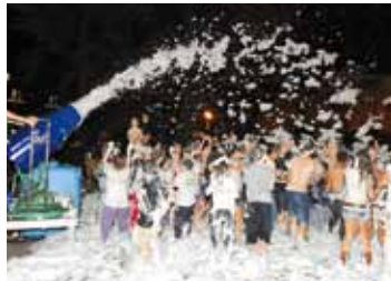
I ragazzi sotto la schiuma