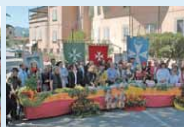
Una panoramica delle persone presenti alla trasmissione