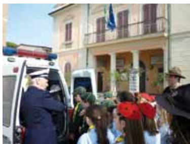
Il gruppo scout di Calcinaia

Tanti bambini sognano da piccoli di diventare un giorno un Vigile del Fuoco, un Carabiniere o un altro membro delle forze di polizia, sono mestieri che affascinano e rendono affascinanti e quest'anno, nel nostro gruppo, qualcuno di questi bambini ha potuto sognare ad occhi aperti! Le Coccinelle del cerchio "Sul Sentiero della Gioia" e i Lupetti del branco "Il Favore della Giungla" del gruppo scout CALCINAIA 1° "San Giovanni Battista" si sono lanciati insieme in una nuova avventura, hanno dimostrato di essere davvero in gamba e sempre pronti in ogni occasione. In questo intento sono stati aiutati da alcune persone che ogni giorno si mettono al servizio del prossimo, con assoluta dedizione, come: i Carabinieri del Comando di Pontedera, i Vigili del Fuoco del comando di Cascina e la Polizia Municipale del nostro comune. Il primo emozionante appuntamento è stato il 10 aprile 2010, quando Lupetti e Coccinelle hanno incontrato chi si occupa della nostra sicurezza sul territorio comunale: la