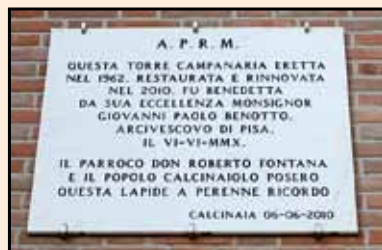
La targa affissa sulla torre campanaria