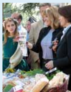
Il Navicello presentato in diretta (foto Ass. Fotografica Fornacette)

Il Comune di Calcinaia ancora sul piccolo schermo. La puntata del programma televisivo "Toscana paese mio" registrata lo scorso 1 giugno in Piazza Indipendenza e già replicata lo scorso 19 luglio, verrà nuovamente riproposta, sulle frequenze di Italia7, lunedì 16 agosto a partire dalle ore 14.00.