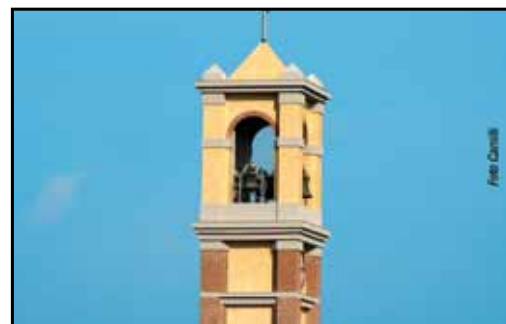
Un particolare del nuovo campanile della chiesa di Calcinaia

Un messaggio cristallino e semplice, ma anche racchiuso in poche parole esplosive e rivoluzionarie che rimandano a una realtà che ogni giorno tocchiamo con mano, cioè